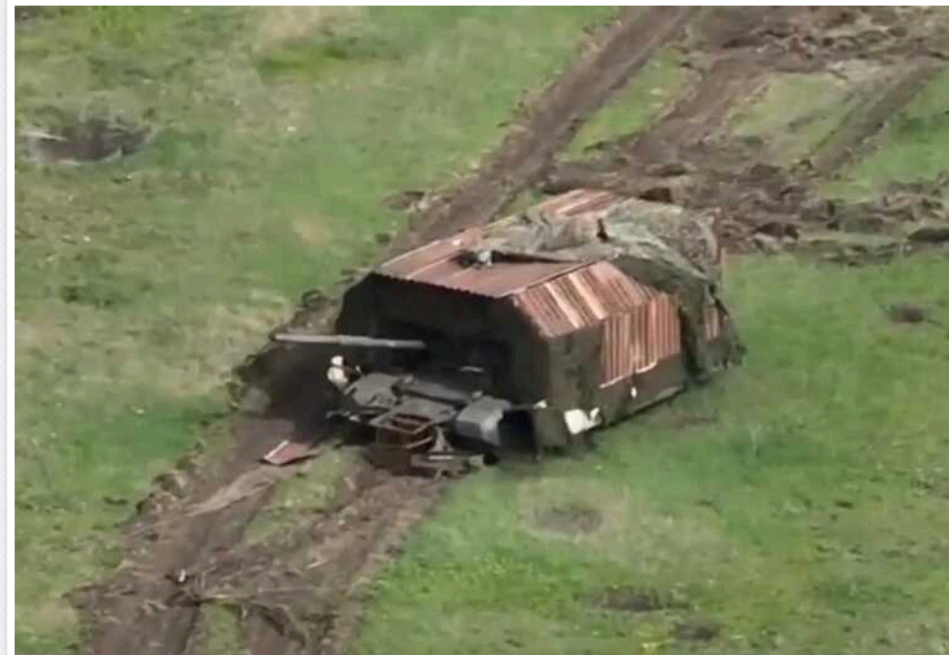
У мережі публікують вражаюче знищення російського «танка-черепахи», що розлітається на шматки

На відео, оприлюдненому у соцмережах 46-ю бригадою ЗСУ, видно жорстоке знищення українськими операторами безпілотників російської модифікованої бронетехніки - «танка-черепахи».