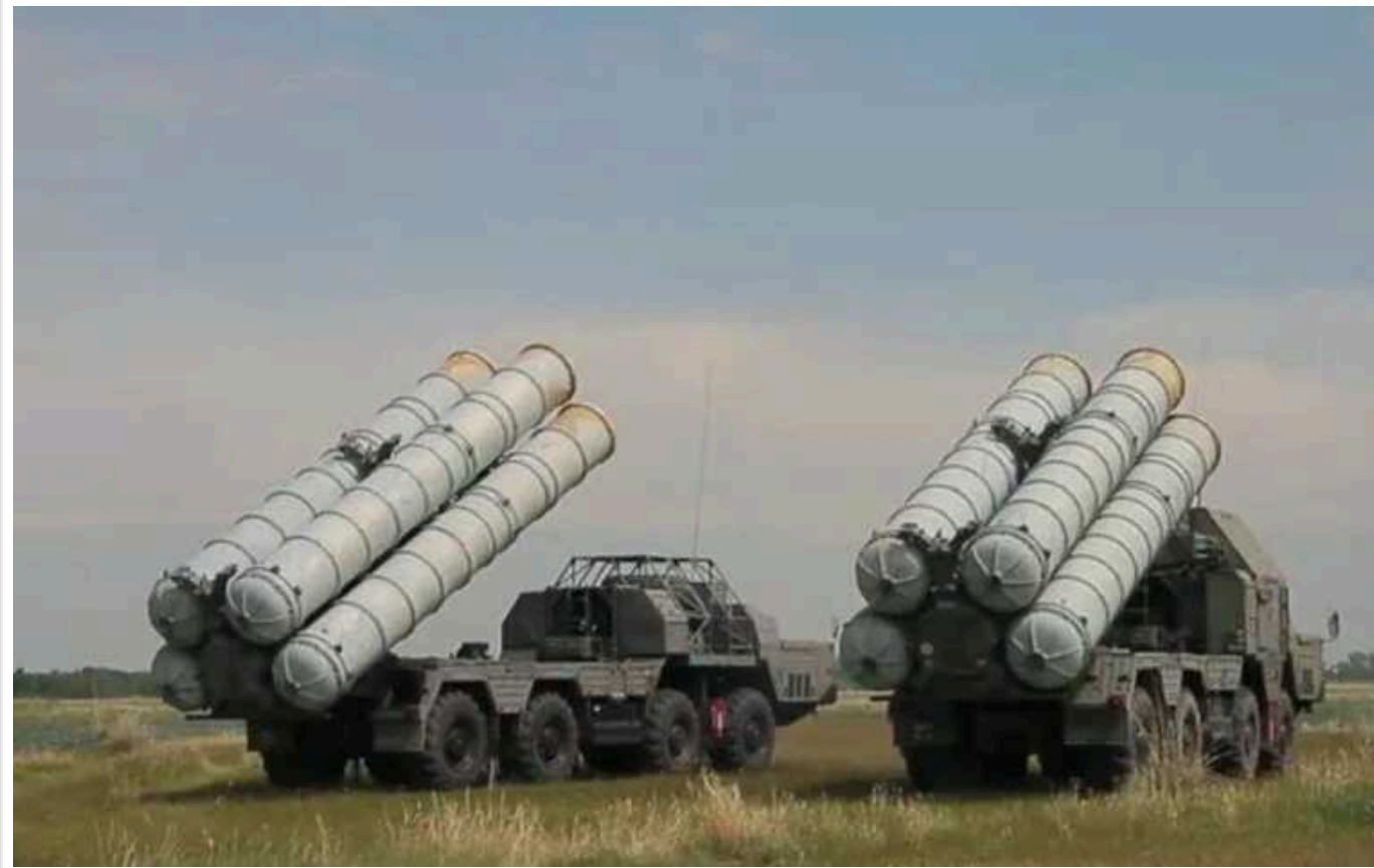
Сили оборони України продовжують знищувати російську ППО в окупованому Криму, - Генштаб

Сьогодні вночі наші війська знову атакували російські зенітні ракетні комплекси, які загарбники розгорнули на українському півострові.