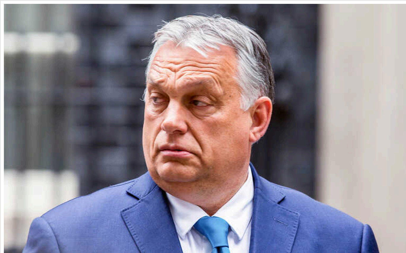
Угорщина не заблокує введення військ НАТО в Україну, якщо це рішення підтримуватиме більшість членів Альянсу, – Орбан

Прем'єр провів переговори з генсеком НАТО Єнсом Столтенбергом. Вони погодили, що Угорщина не перешкоджатиме рішенням Альянсу щодо України.