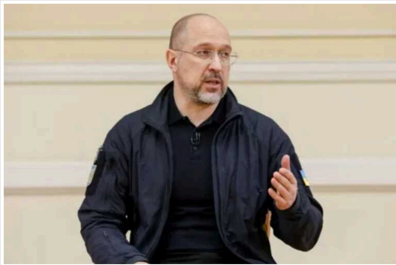
ЗМІ стало відомо, чому прем'єр Шмигаль "спростував" плани щодо підвищення податків

Прем'єр-міністр Денис Шмигаль спростував плани щодо підвищення податків, хоча насправді вони розроблялися останні кілька місяців. Сам глава уряду в особистих розмовах із урядовцями не зміг пояснити, чому він зробив таку заяву. Ймовірно, Шмигаль роззубився, відповідаючи на запитання нардепа Дмитра Разумкова.