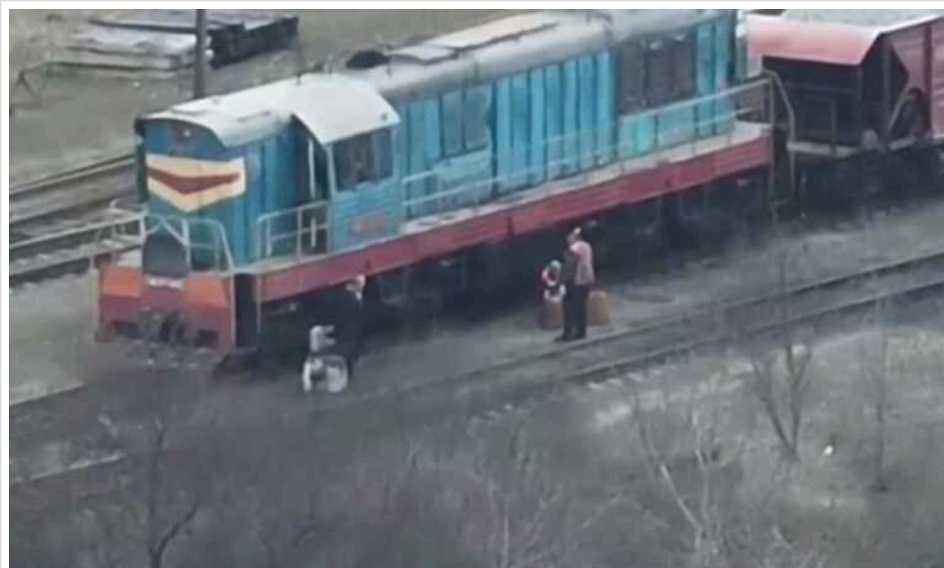
У Полтавській області затримано співробітників УЗ, підозрюваних у розкраданні палива на півмільйона гривень