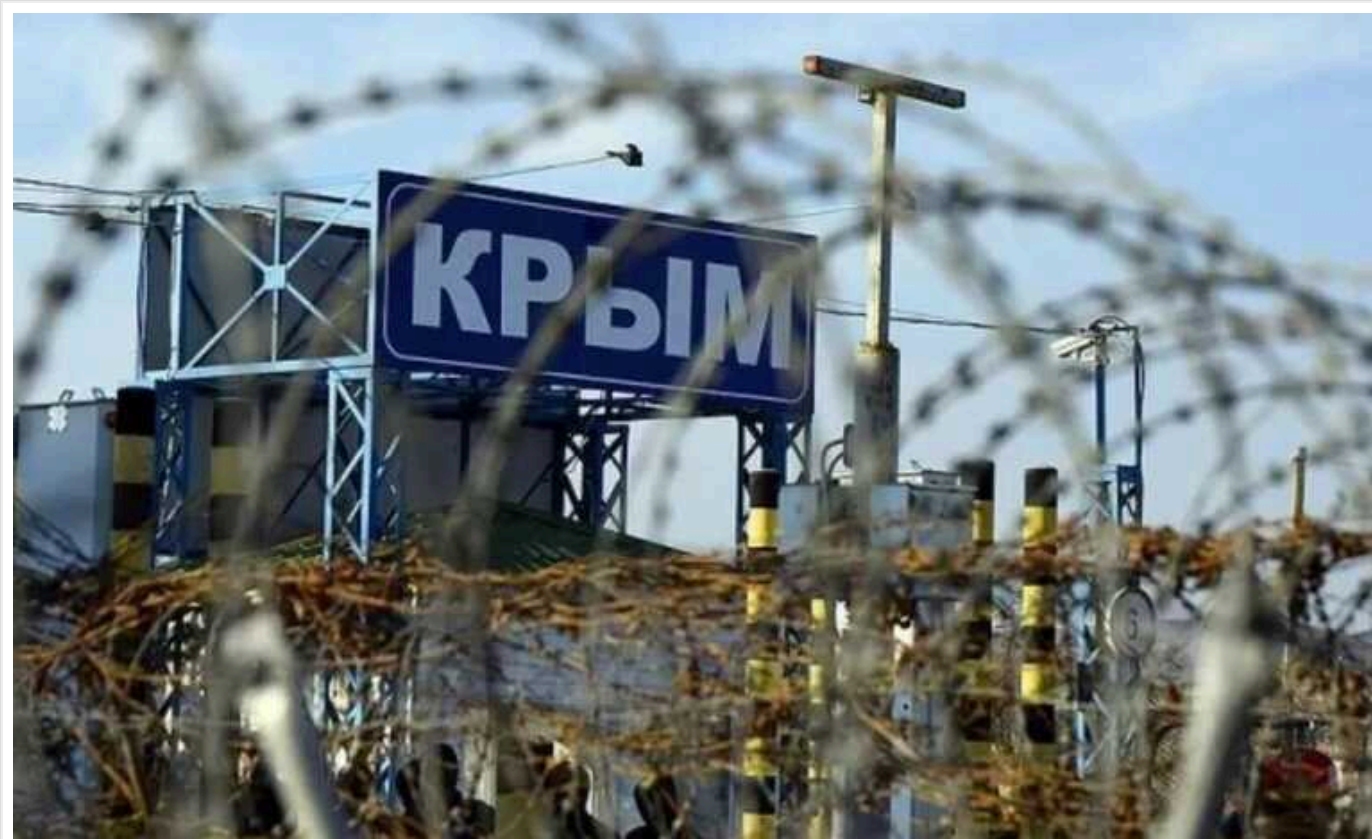
В окупованому Криму, нібито, «націоналізували» активи Яценюка, Джамали та інших українців

У Яценюка вилучили навчальний корпус, гараж та велику земельну ділянку в Ялті.