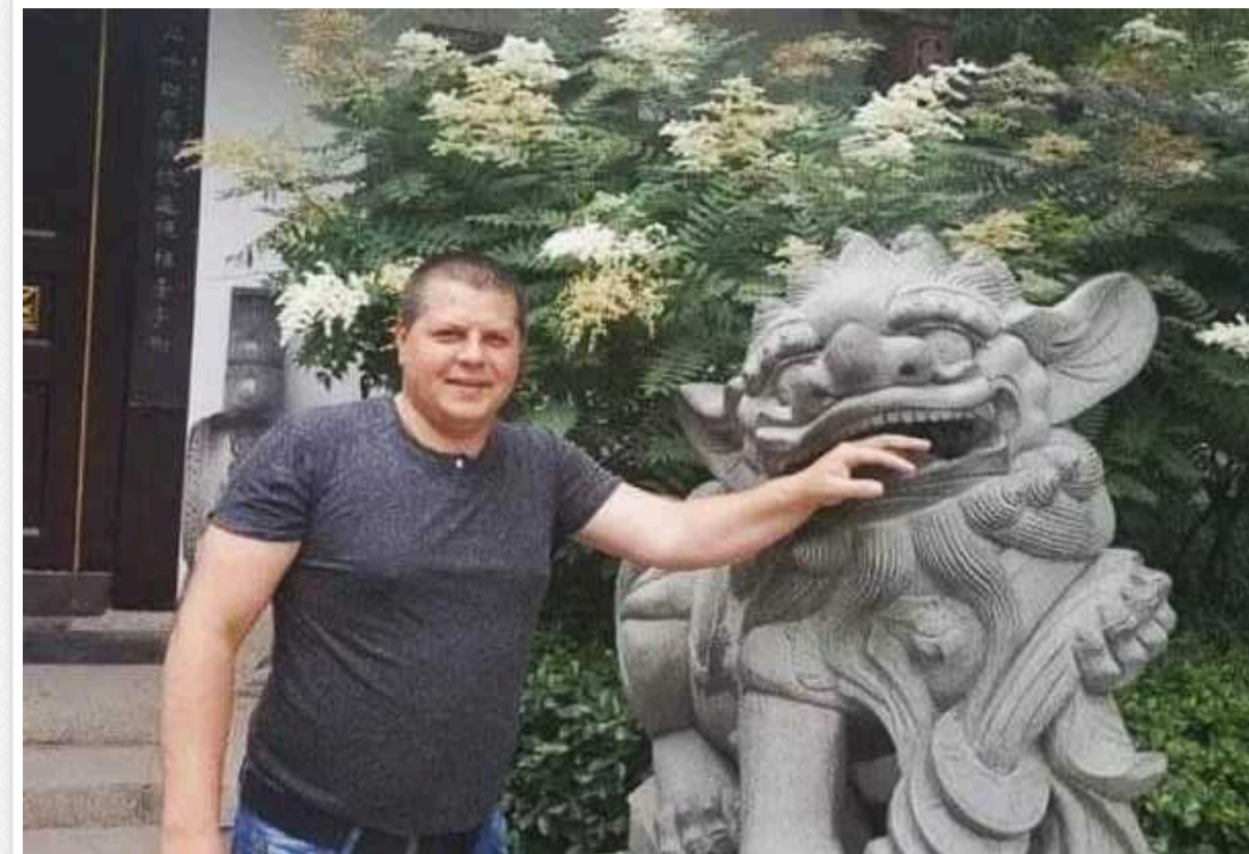
Придунайська марихуана: на Одещині під прикриттям постачання солі ЗСУ процвітає мільярдний наркобізнес

Місцевий наркодилер за 2 роки війни придбав 6 елітних автівок та купує паї під нові плантації.