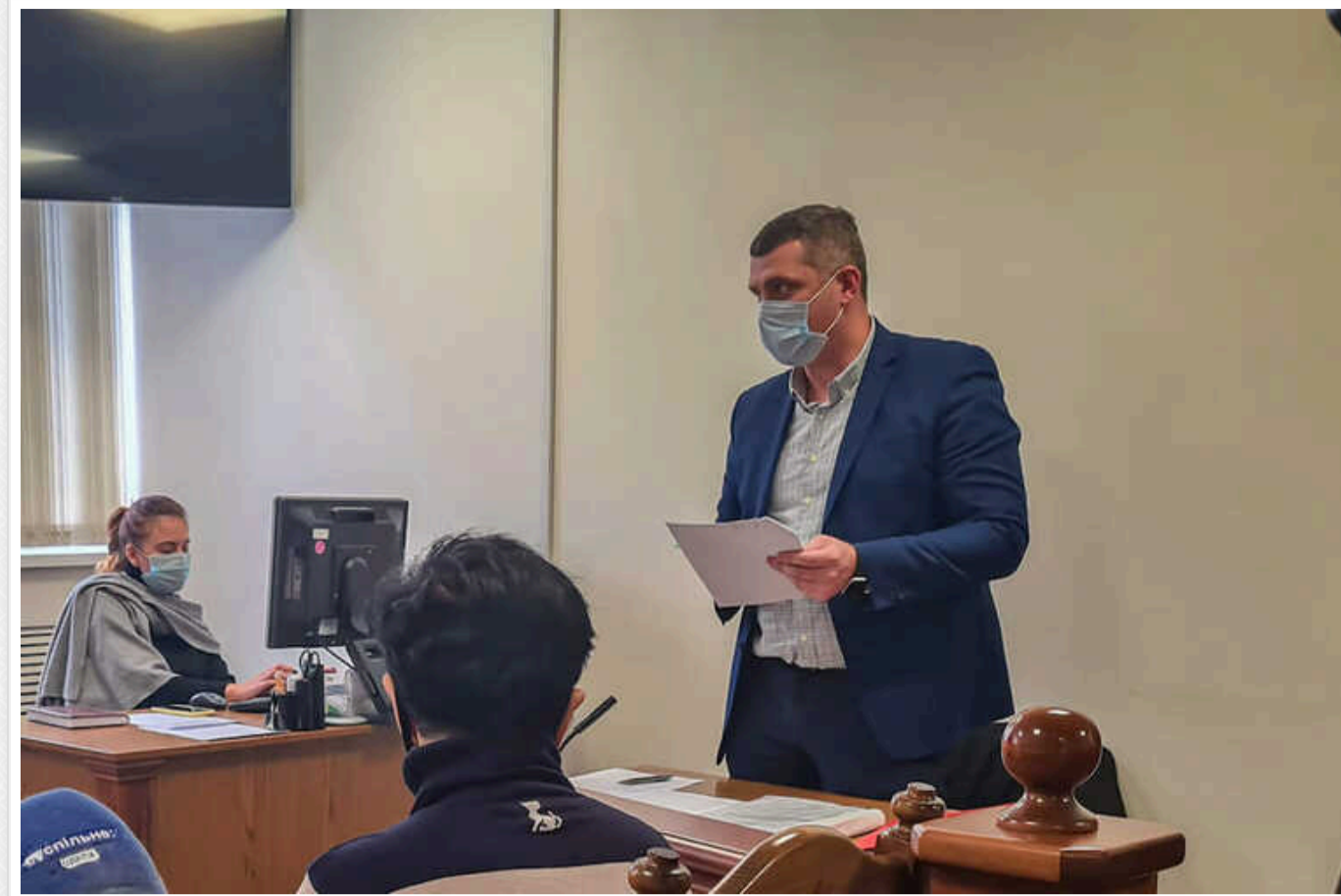
ЗМІ: Прокурор Євген Антощук намагається відібрати майно у законних власників