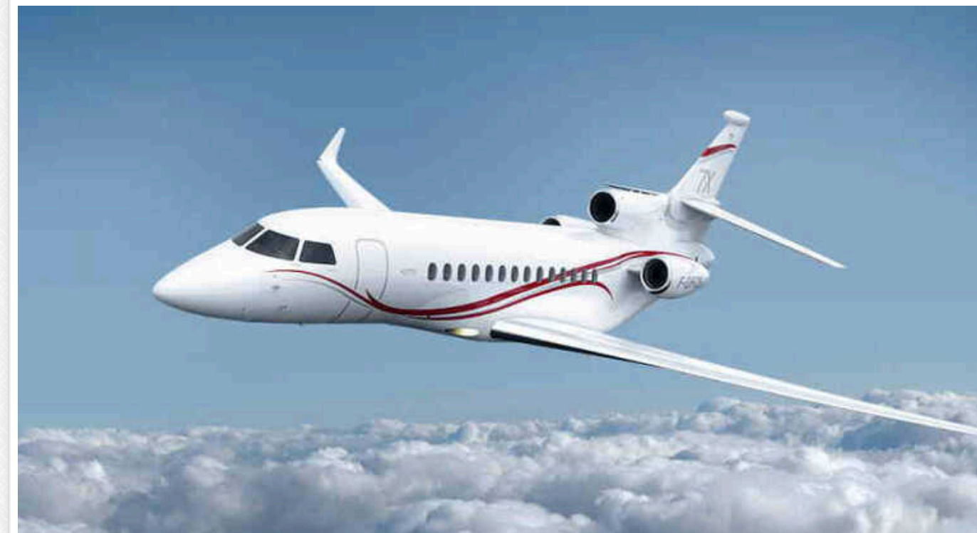
Родичі Путіна купують на Заході яхти та запчастини для бізнес-джетів

Попри західні санкції, компанії, пов'язані з племінником Володимира Путіна, придбали розкішний французький вітрильник, а фірма, що обслуговує бізнес-джет Аліни Кабаєвої, яку називають коханкою диктатора, безперешкодно імпортує запчастини західного виробництва. Ці дії підкреслюють, як близьке оточення Путіна продовжує вести розкішний спосіб життя, обходячи міжнародні обмеження.