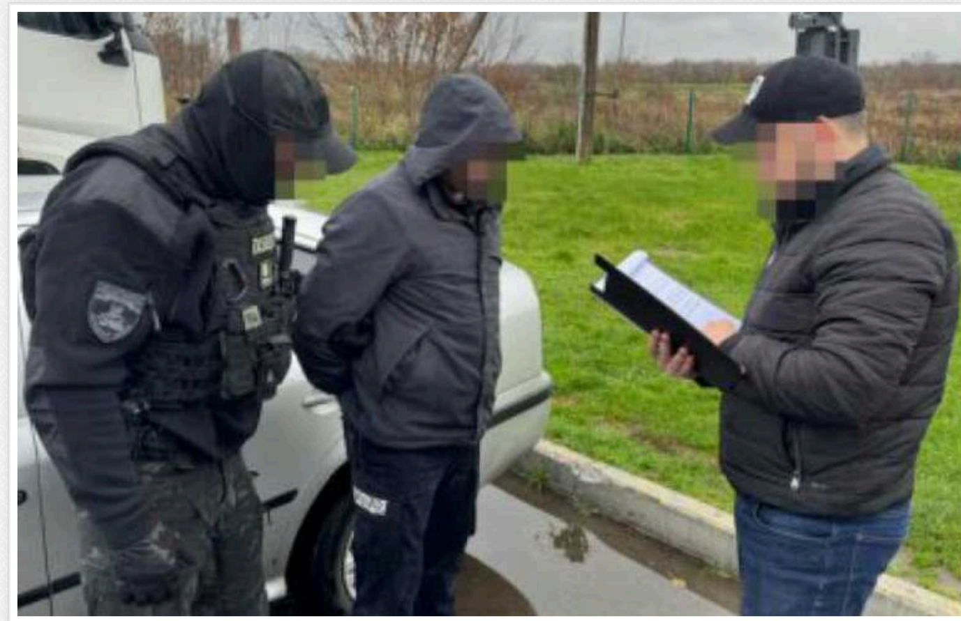
Судитимуть правоохоронців, які переправляли чоловіків за кордон під виглядом осіб з інвалідністю

ДБР завершило розслідування щодо правоохоронців, які переправляли чоловіків за кордон під виглядом осіб з інвалідністю.