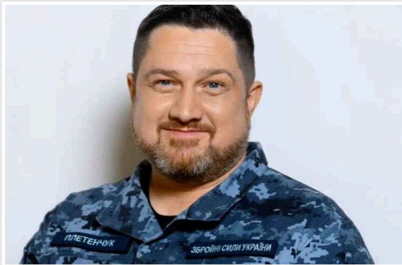
Плетенчук іде з посади пресофіцера Сил оборони півдня

Очільник Центру стратегічних комунікацій та речник Сил оборони півдня Дмитро Плетенчук повідомив, що залишає цю посаду, яку він обіймав з квітня 2024 року, і повертається до виконання обов'язків речника ВМС.