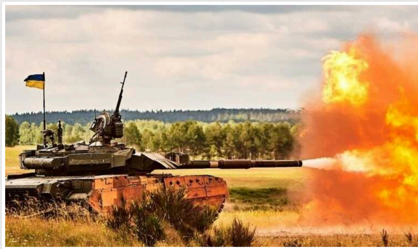
У ЗСУ заявили про успіхи на Харківщині

Бійці зазначають, що командування та підрозділи діють грамотніше та згуртованіше, ніж це було на будь-якому іншому напрямку.