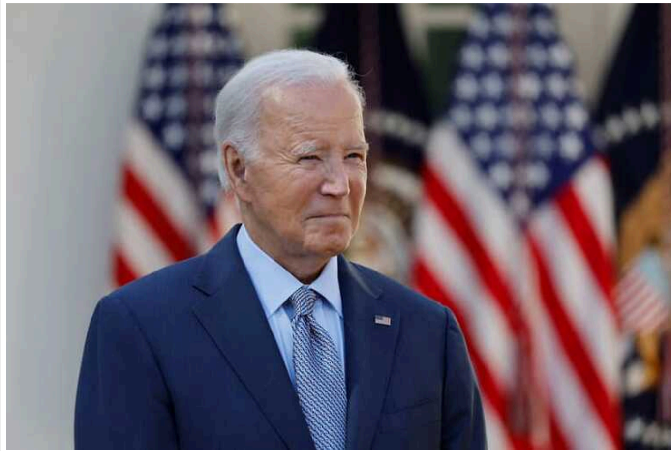
Вибори в США: вперше за місяць Байден випередив Трампа

На думку журналістів Forbes, ці результати пов'язані із визнанням Трампа винним у справі про виплати порноакторці.