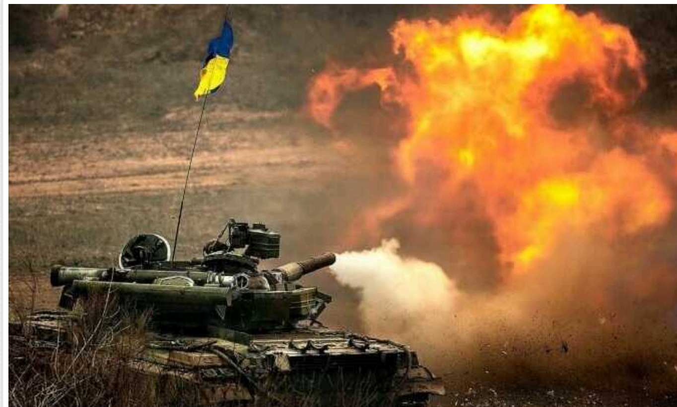
ISW: ЗСУ пішли в контратаку і відновили втрачені позиції у напрямку Липців

Аналітики ISW також повідомили про продовження боїв у Вовчанську, зокрема, в районі Вовчанського агрегатного заводу, а також поблизу сіл Тихе та Вовчанські Хутори.