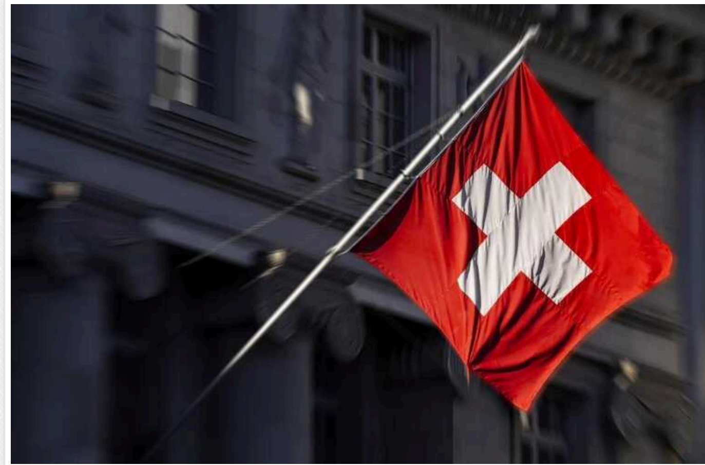
78 країн та організацій підтвердили свою участь у Саміті миру у Швейцарії

Радіо Свобода повідомляє, що кількість країн та організацій, які підтвердили свою участь у Саміті миру у Швейцарії, знизилася з 93 до 78.