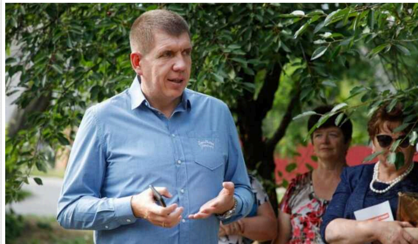
ВАКС знову продовжив зобов'язання обвинуваченому нардепу Гуньку

Вищий антикорупційний суд продовжив до 5 серпня строк дії зобов'язань, покладених на народного депутата Анатолія Гунька. Спеціалізована антикорупційна прокуратура обвинувачує його в одержанні 85 тисяч доларів неправомірної вигоди.