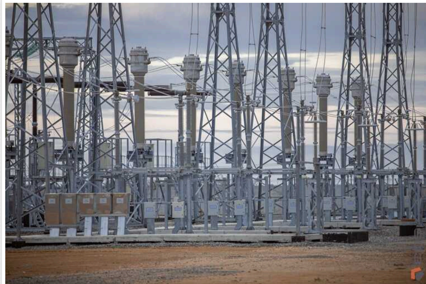
Німеччина виділить Україні 30 мільйонів євро на реконструкцію електропідстанції

НЕК "Укренерго" підписала кредитну угоду з німецьким державним банком розвитку KfW на суму 30,4 млн євро.