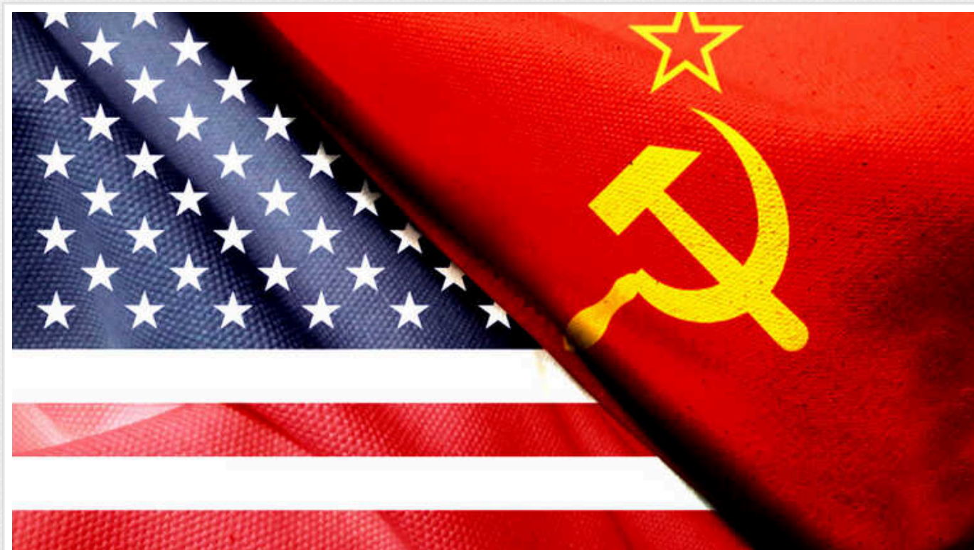
Сполучені Штати без розгляду депортуватимуть мігрантів із 6 країн колишнього СРСР

Це стосується Грузії, Молдови, Киргизії, Росії, Таджикистану та Узбекистану.