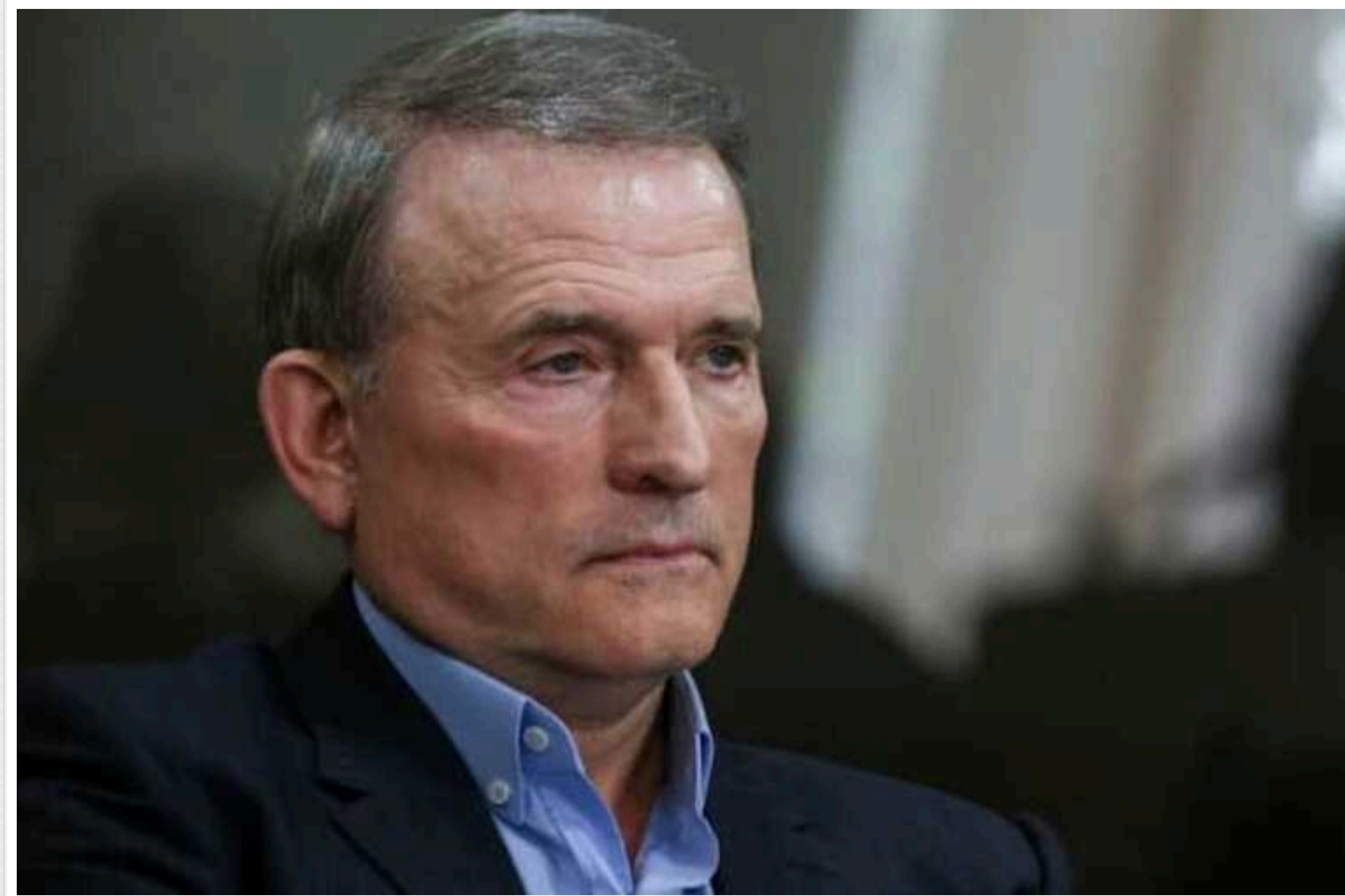
Кум Путіна Медведчук знову намагався поновити свідоцтво адвоката