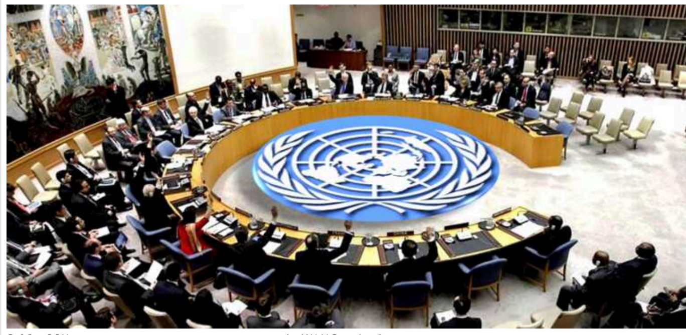
Радбез ООН схвалила тимчасове припинення вогню між ХАМАС та Ізраїлем

Лінда Томас-Грінфілд закликала ХАМАС прийняти пропозицію щодо припинення вогню.