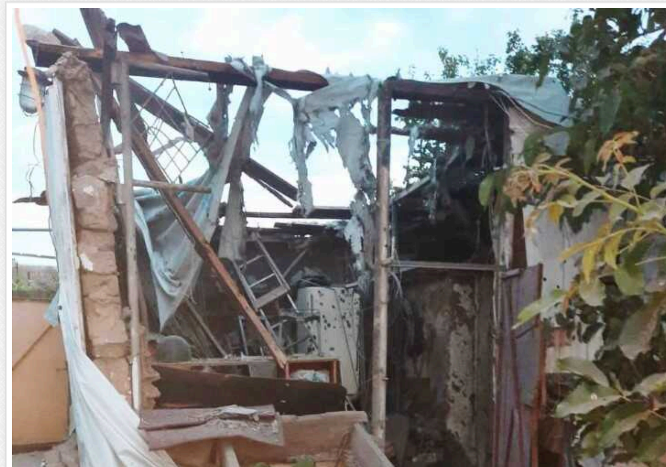
Росіяни вдарили по Нікополю 6 дронами: пошкоджено інфраструктурний об'єкт

Російські загарбники сьогодні вранці, 11 червня, завдали удару дронами-камікадзе по Нікополю. Через ворожу атаку у місті був пошкоджений інфраструктурний об'єкт.