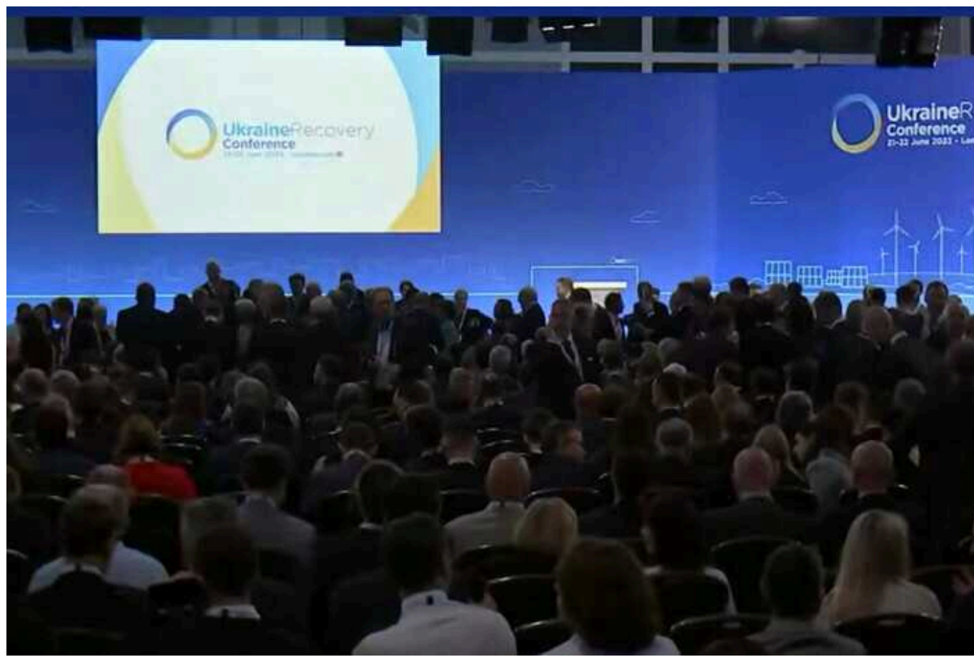
У Берліні стартує Ukraine Recovery Conference

Конференція з відновлення України – Ukraine Recovery Conference – стартує в Берліні за участі Президента України Володимира Зеленського та канцлера ФРН Олафа Шольца.