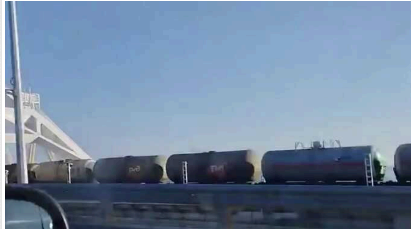
Росіяни почали знову возити пальне Керченським мостом, який може бути уражений, - ISW

Аналітики Інституту вивчення війни (ISW) вважають, що українські удари по російських військових і логістичних об'єктах могли змусити російські війська змінити свою дислокацію і транспортні схеми.