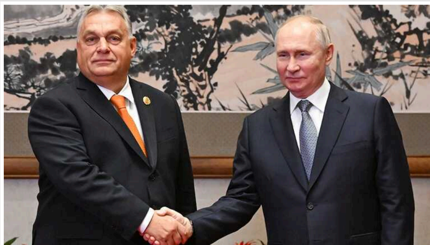
Угорщина може бути позбавлена права вето в ЄС: витівки Орбана в Європі дістали всіх

Як повідомляє західна преса, в Раді Європейського Союзу вперше офіційно була висловлена ідея розпочати процедуру позбавлення Угорщини, яка наступного місяця має отримати головування в Раді, права вето. З такою пропозицією виступила Бельгія, яка наразі головує в Раді ЄС на ротаційній основі, повідомила голова Міністерства закордонних справ Бельгії Аджі Лябіб в інтерв'ю виданню Politico