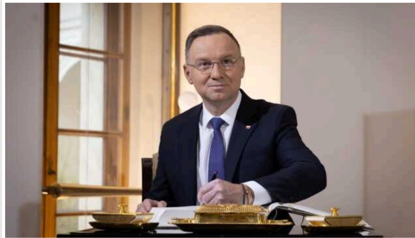
Дуда підписав закон про продовження допомоги біженцям з України у Польщі

Президент Польщі Анджей Дуда 7 червня підписав зміни до спецзакону про допомогу українцям, які знайшли прихисток у Польщі після початку повномасштабного вторгнення Росії в Україну.