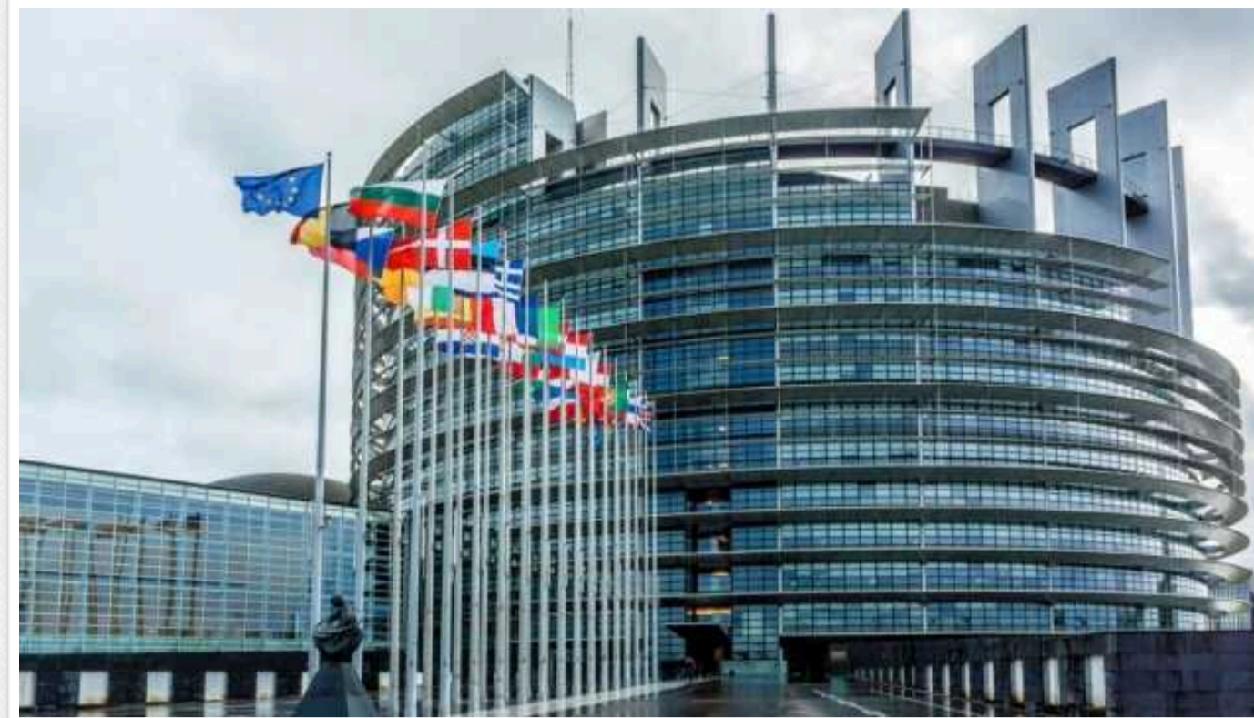
Вибори до Європарламенту: в Австрії перемагають проросійські праві популісти

Правопопулістська та проросійська Австрійська партія свободи (FPÖ) отримувє 25,7% голосів на виборах до Європарламенту, трохи випереджаючи таким чином правлячу Австрійську народну партію (ÖVP).