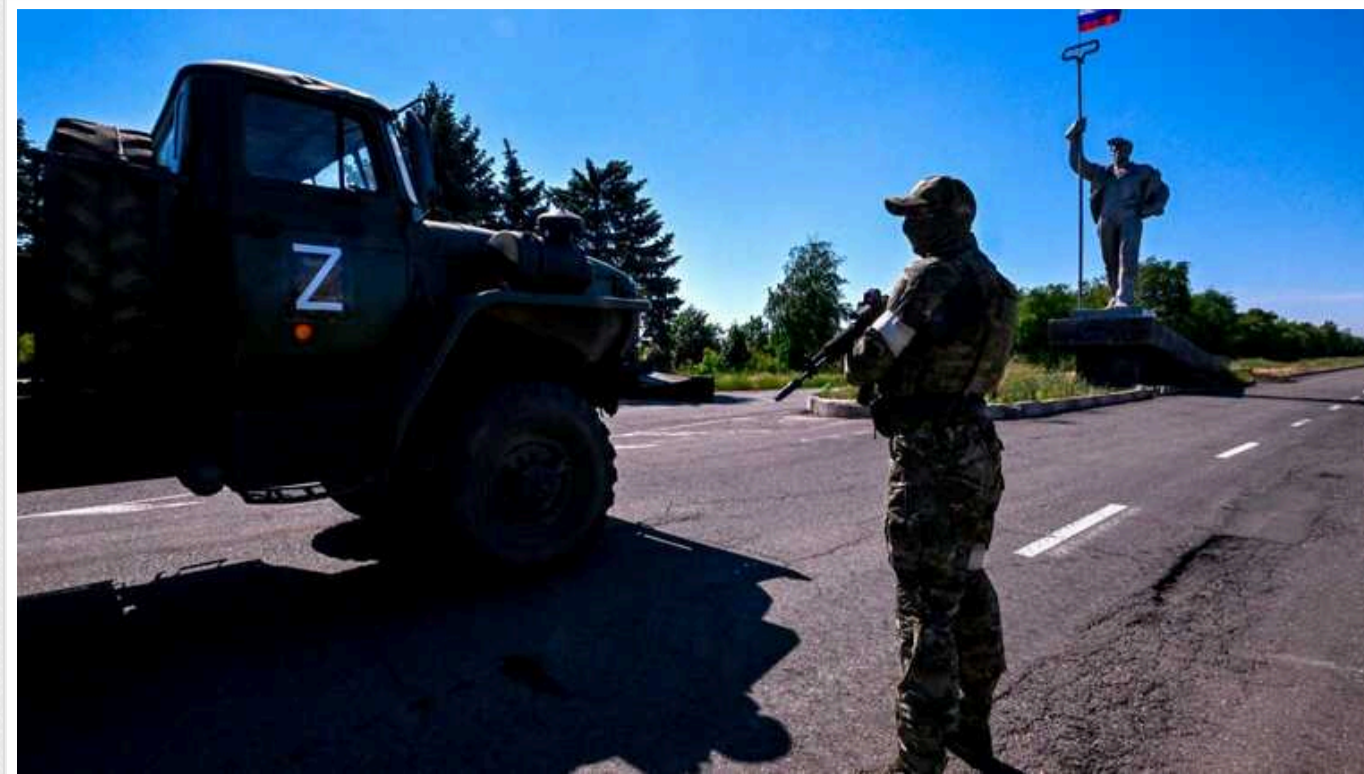
Російським військовим ППО рекомендували евакуюватися з окупованого Криму зі сім'ями, – "АТЕШ"

Військовослужбовці ППО Збройних сил РФ отримали наказ про евакуацію сімей із Криму. Разом з тим окупанти створюють нові мобільні групи ППО для боротьби з українськими дронами.