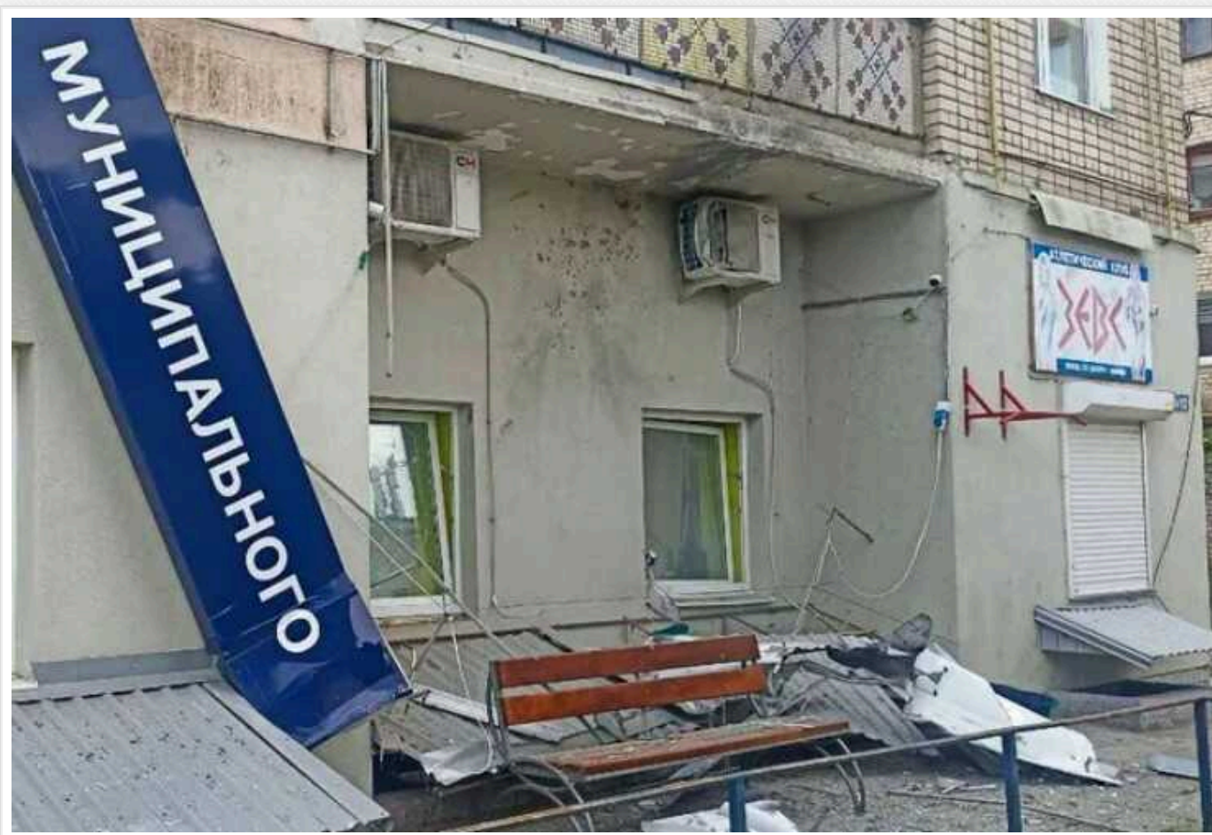
В окупованій Каховці дрон атакував "адміністрацію" міста

У захопленій Каховці на лівобережжі Херсонщини дрон атакував будівлю окупаційної міської адміністрації. У результаті приміщення, яке використовували окупанти, пошкоджено, однак втрач серед загарбників, попередньо, немає.