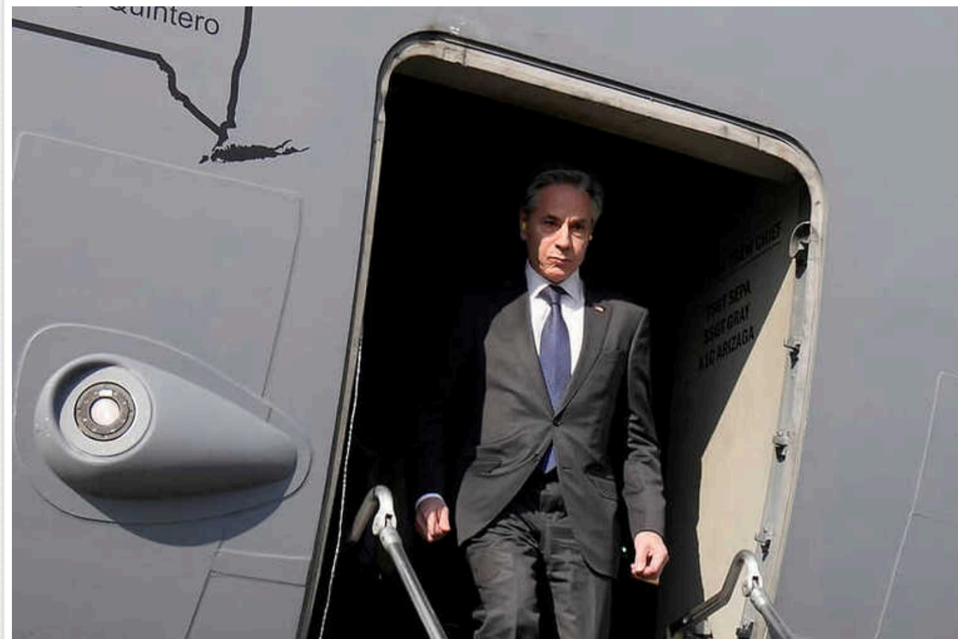
Держсекретар США Ентоні Блінкен прибув на Близький Схід, сподіваючись домогтися припинення вогню в Газі

Держсекретар Сполучених Штатів Ентоні Блінкен прибув на Близький Схід у понеділок, сподіваючись домогтися припинення вогню в Газі, що минулого місяця запропонував президент США Джо Байден.