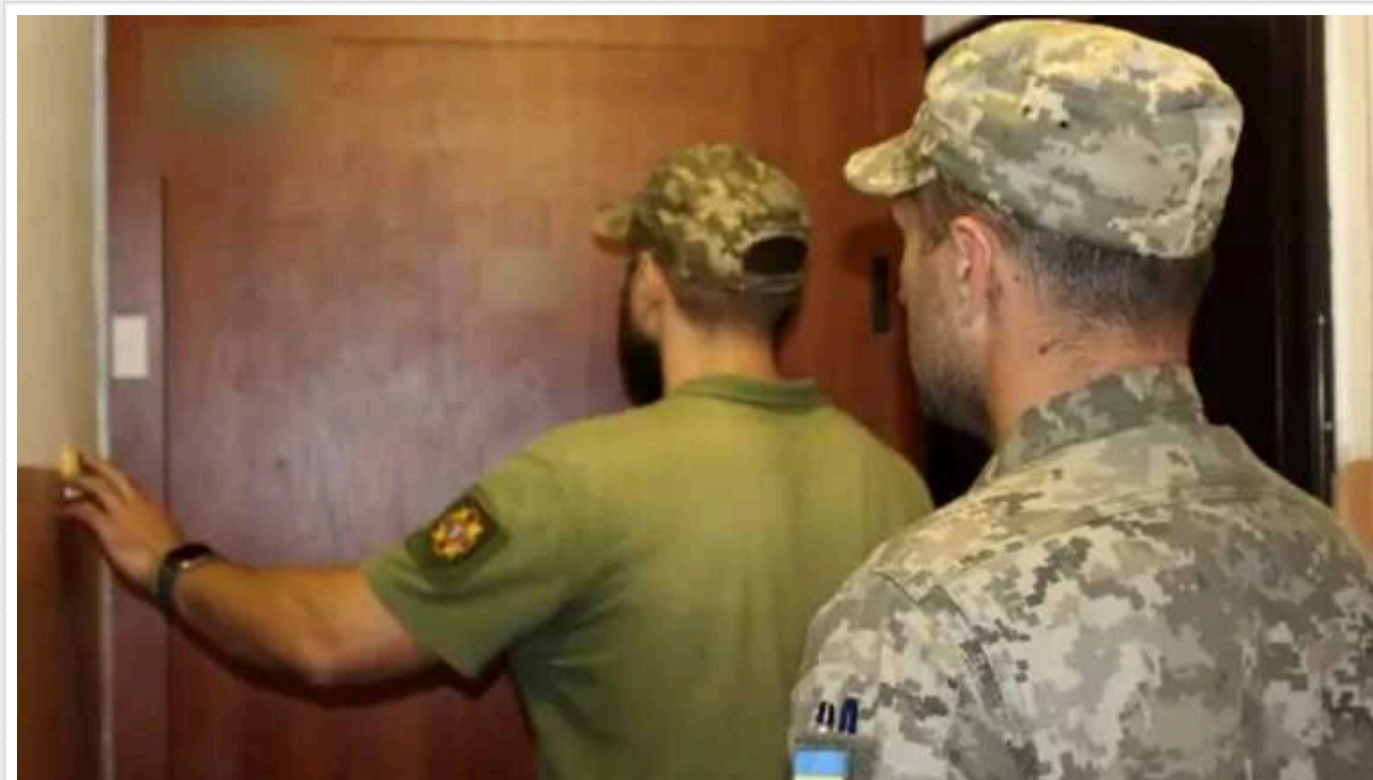
Скандал з ТЦК на Тернопільщині: затриманий чоловік попросив не розглядати скаргу його доньки

У ТЦК заявили, що чоловік має свідому активну громадянську позицію, патріотично налаштований щодо участі чоловіків у протистоянні російській агресії та служби в ЗСУ і самостійно та добровільно зробив свій вибір.