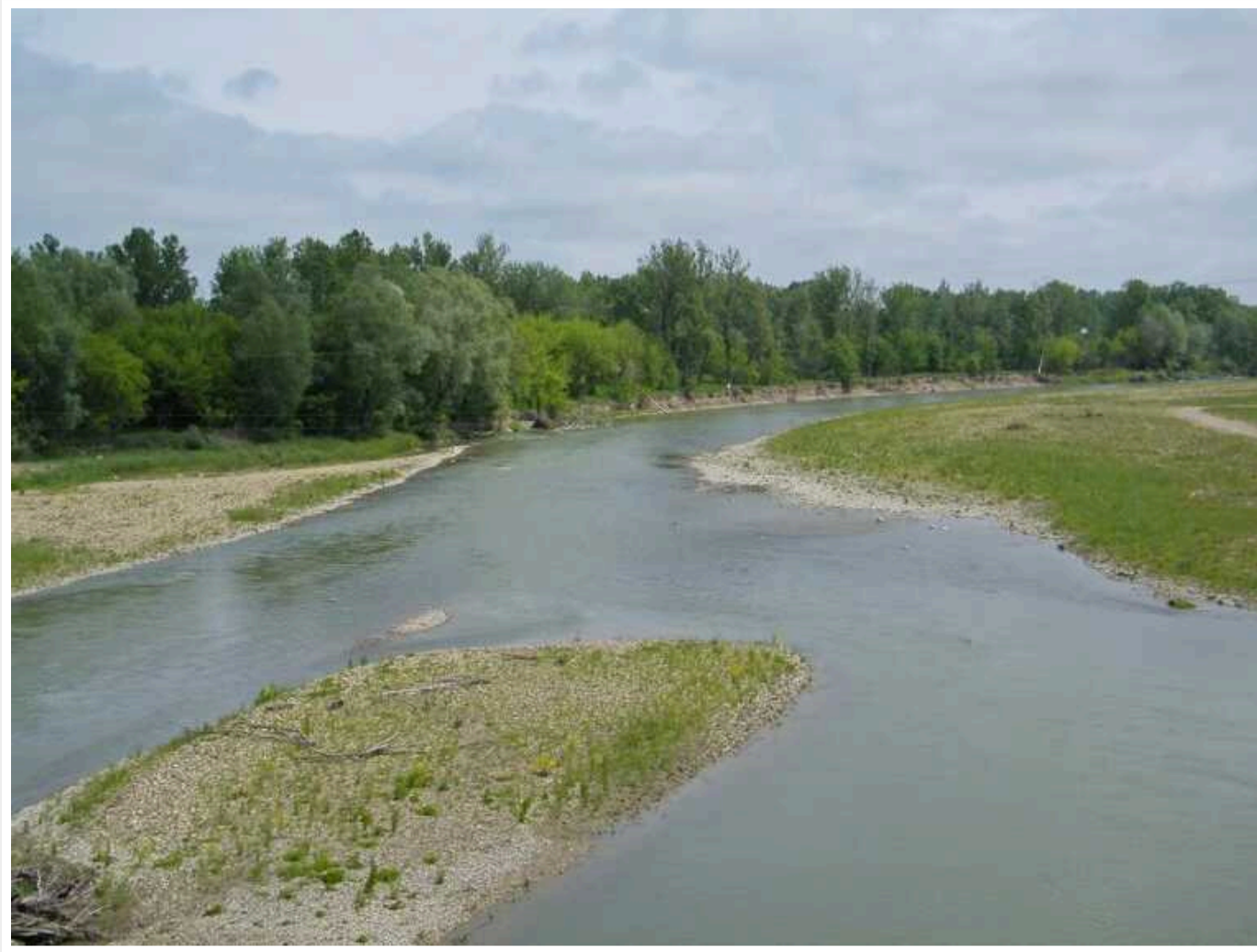
У Чернівцях не березі річки Прут знайшли туші свиней, заражені африканською чумою, - ЗМІ

Про це повідомляють місцеві ЗМІ із посиланням на Держпродспоживслужбу.