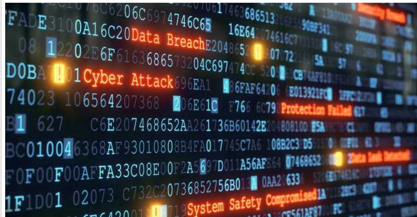
У Швейцарії напередодні Саміту миру фіксують збільшення кібератак

Швейцарія зафіксувала збільшення кількості кібератак та дезінформації напередодні Саміту миру, який відбудеться 15-16 червня.