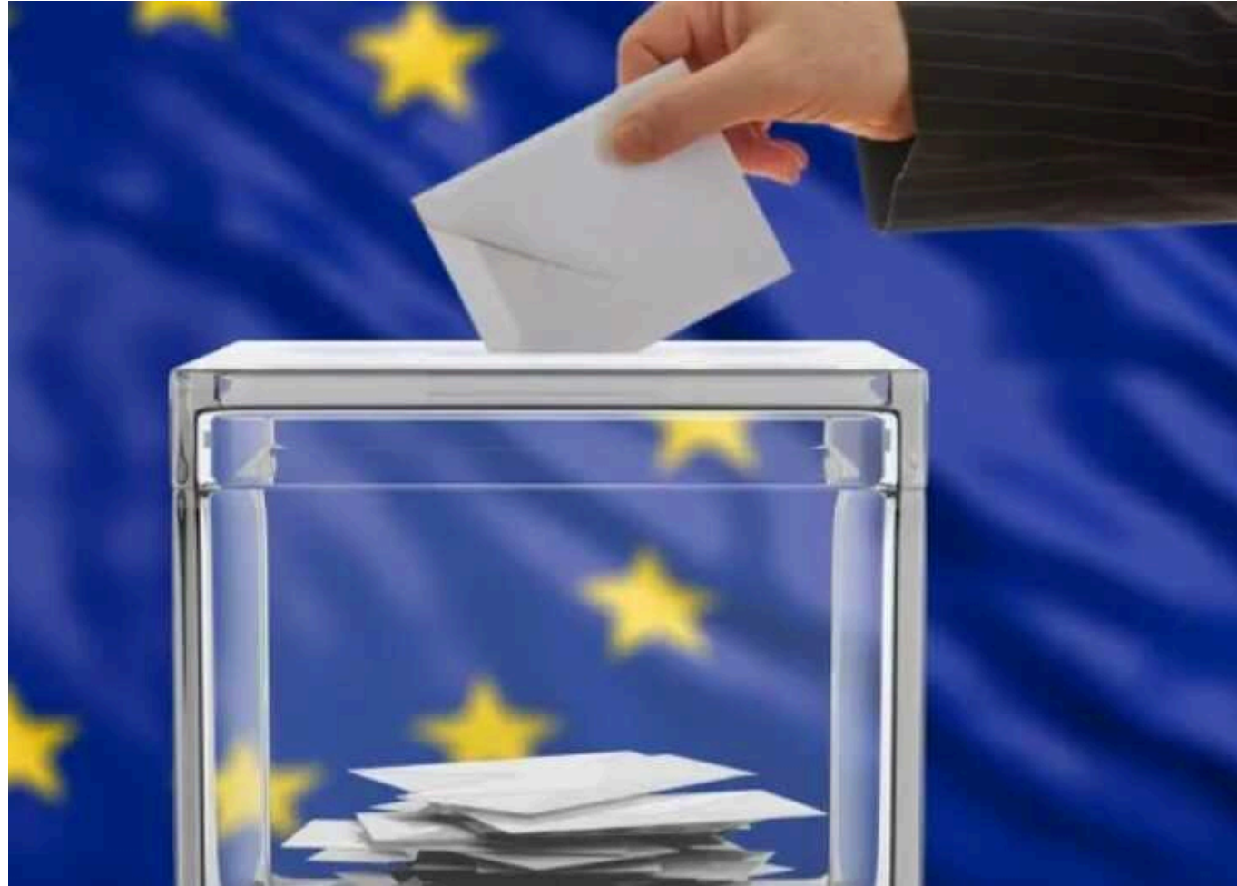
Про що свідчать результати виборів до Європарламенту. Влада Макрона, Шольца й Орбана похитнулася?

На виборах до Європейського парламенту, які завершилися 9 червня, перемагає проукраїнська Європейська народна партія (ЄНП). Вона здобуває 185 із 720 місць у новому скликанні ЄП. Другою за чисельністю фракцією залишається Прогресивний альянс соціалістів і демократів, який отримує 137 місць. У трійці лідерів - об'єднання лібералів "Оновлюючи Європу" – 79 місць. Далі розташувалися європейські консерватори і реформісти – 73 місця, а у правих націоналісти об'єднання "Ідентичність і демократія" – 58 місць.