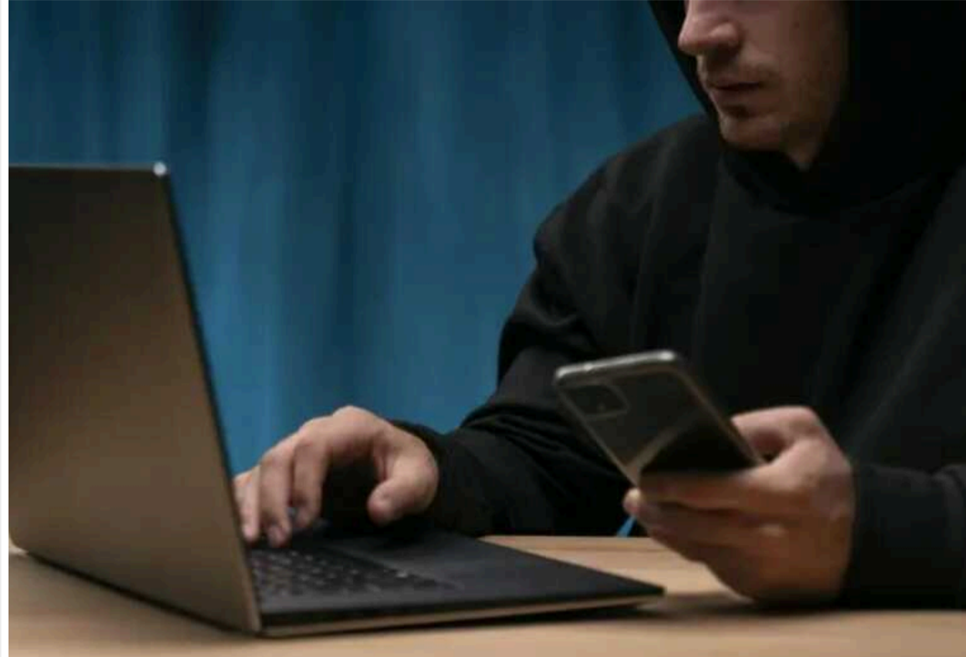
Аферисти взялися за родичів зниклих в окупації: розкрито нову схему обману

В Україні активізувалися шахраї, які видурюють гроші в українців, чії родичі перебувають у полоні в окупантів.