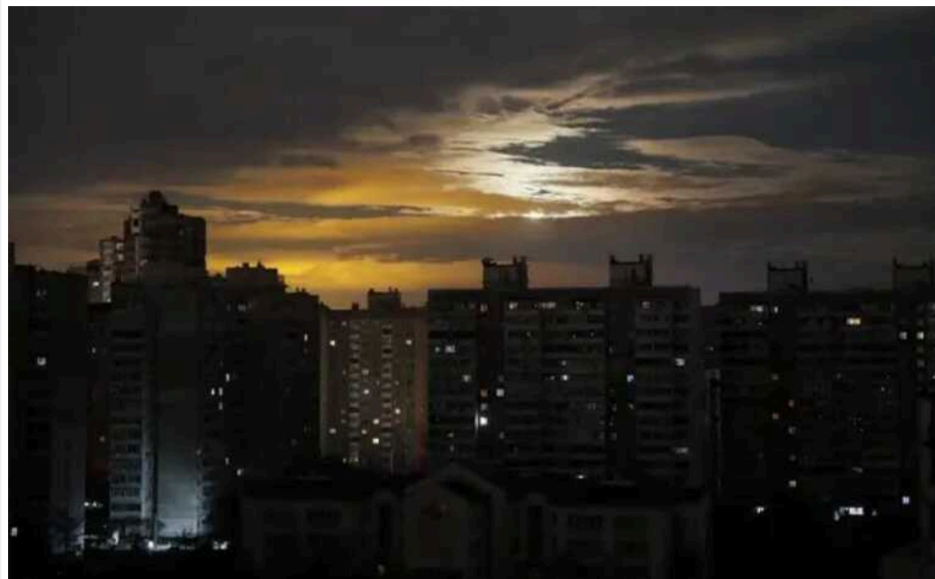
В Україні упродовж двох тижнів ситуація зі світлом має стабілізуватися

Ліміти споживання знизять із 24 червня, повідомив радник прем'єра з питань енергетики Юрій Бойко.