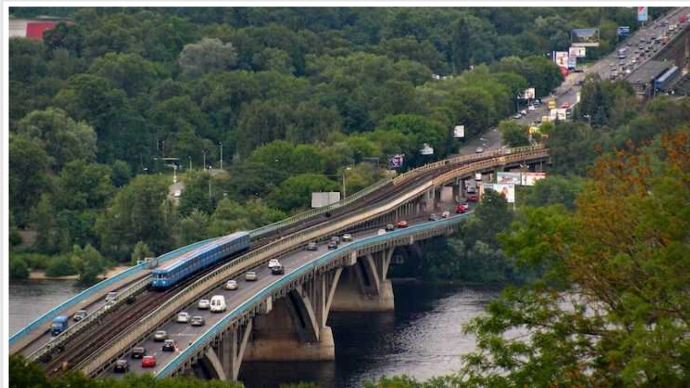
Міст Метро у Києві готують до ремонту за 2 мільярда гривень

Комунальна корпорація “Київавтодор” оголосила пошук підрядника для ремонту за 2 млрд гривень мосту Метро, який вже багато років визнаний аварійним. В столичній адміністрації зізнаються, що за ці кошти йдеться тільки про протиаварійні роботи, адже вартість глобальної перебудови цього мосту оцінюють у півмільярда євро.