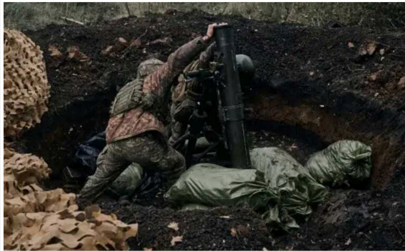
Окупанти прорвалися в Очеретине майже без бою, — DeepState

Аналітики заявили, що 115 ОМБр ЗСУ "не планувала" обороняти Очеретине. Те, що бригада зазнала втрат і краху на фронті, пояснили відсутністю взаємодії та брехнею у доповідях.