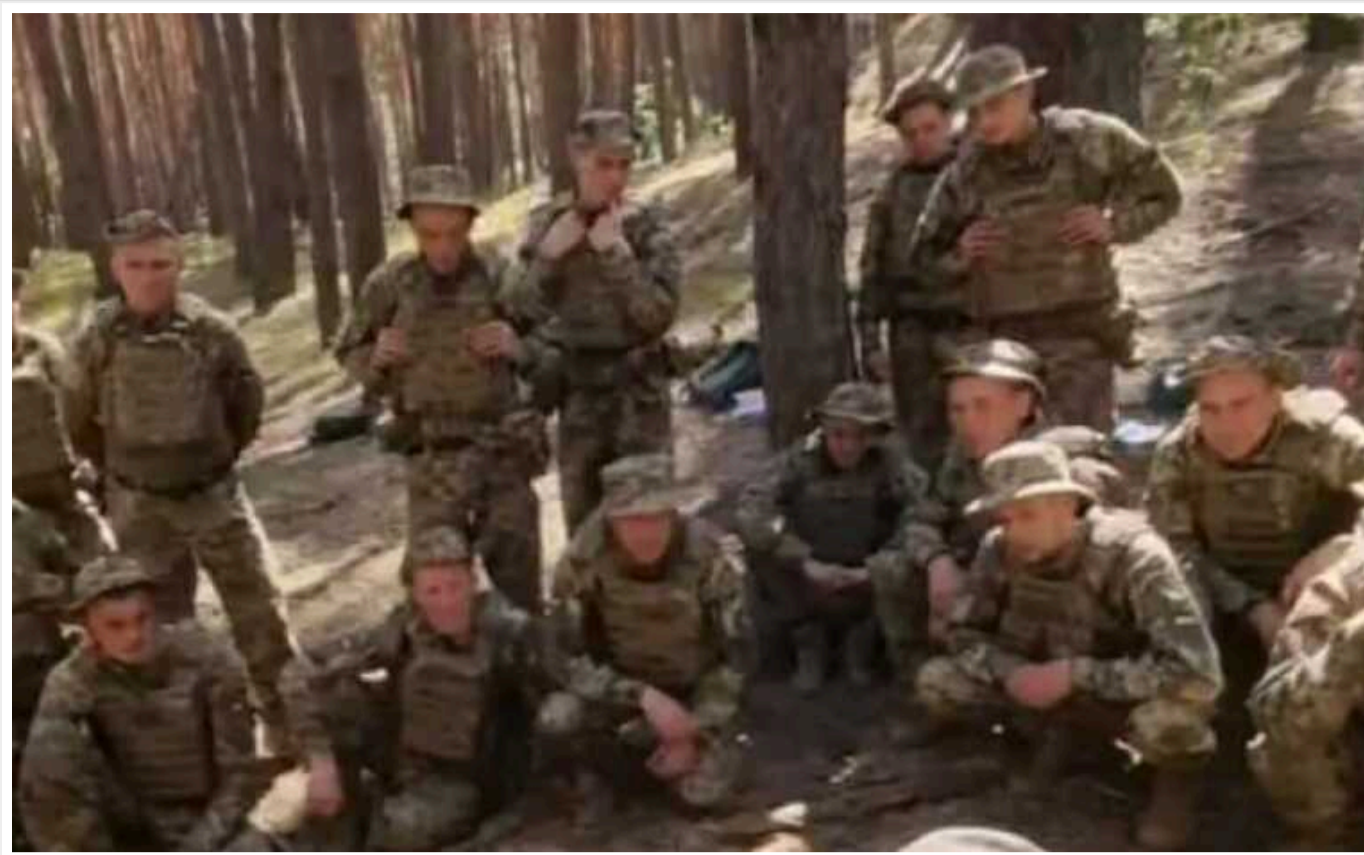
Перший батальйон колишніх в'язнів уже майже на фронті

За словами Андрія Цаплієнка, ці екзасуджені захотіли піти воювати ще до того, як парламент дозволив певним категоріям ув'язнених мобілізуватися. Журналіст зазначив, що вони психологічно більш готові до стресових ситуацій, ніж звичайні люди.