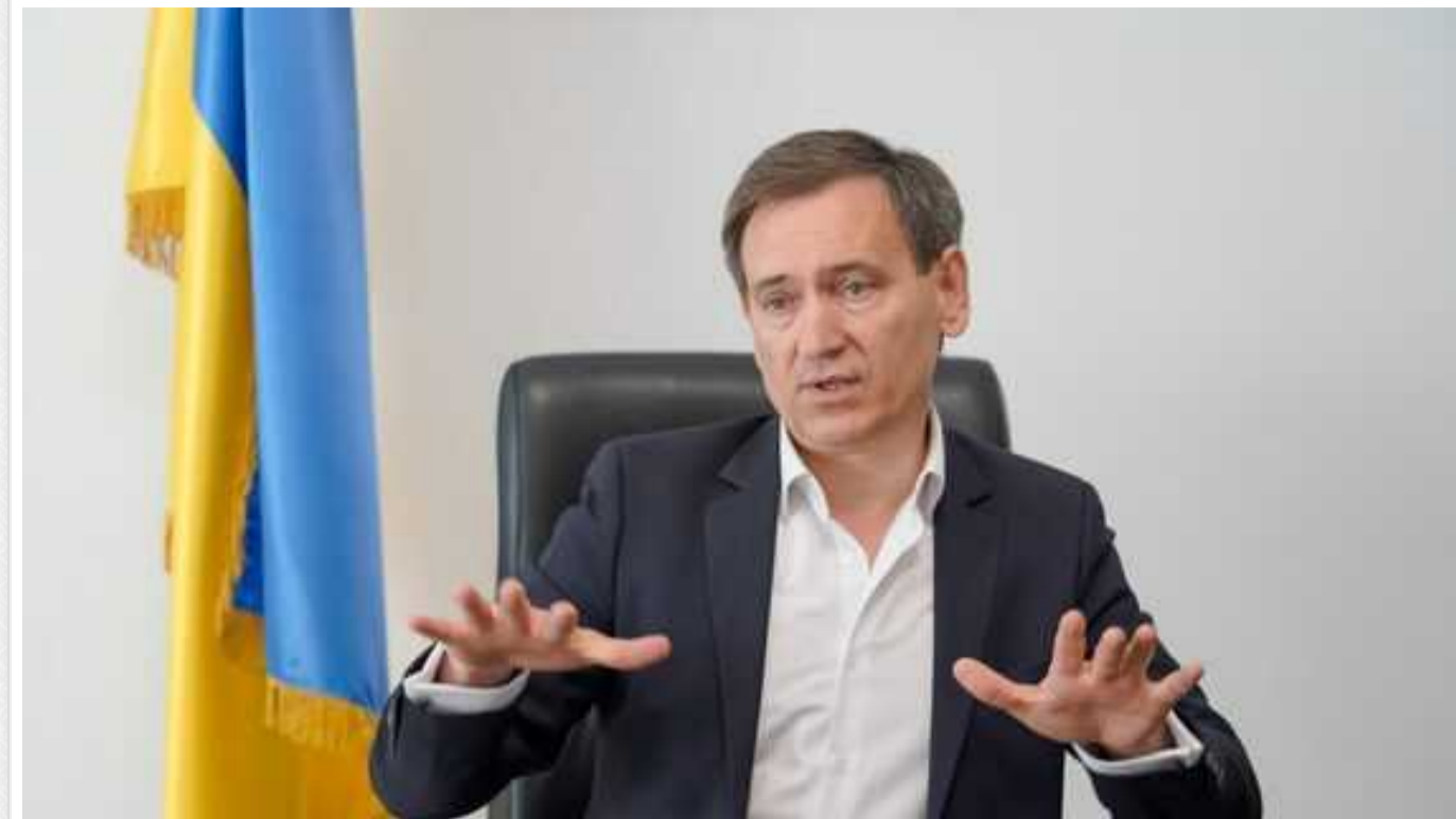
Лише деякі підприємства зможуть забронювати до 100% працівників, інші – лише до 50%, – Веніславський

Читати на русском Read in English Додати як бажане джерело в Google