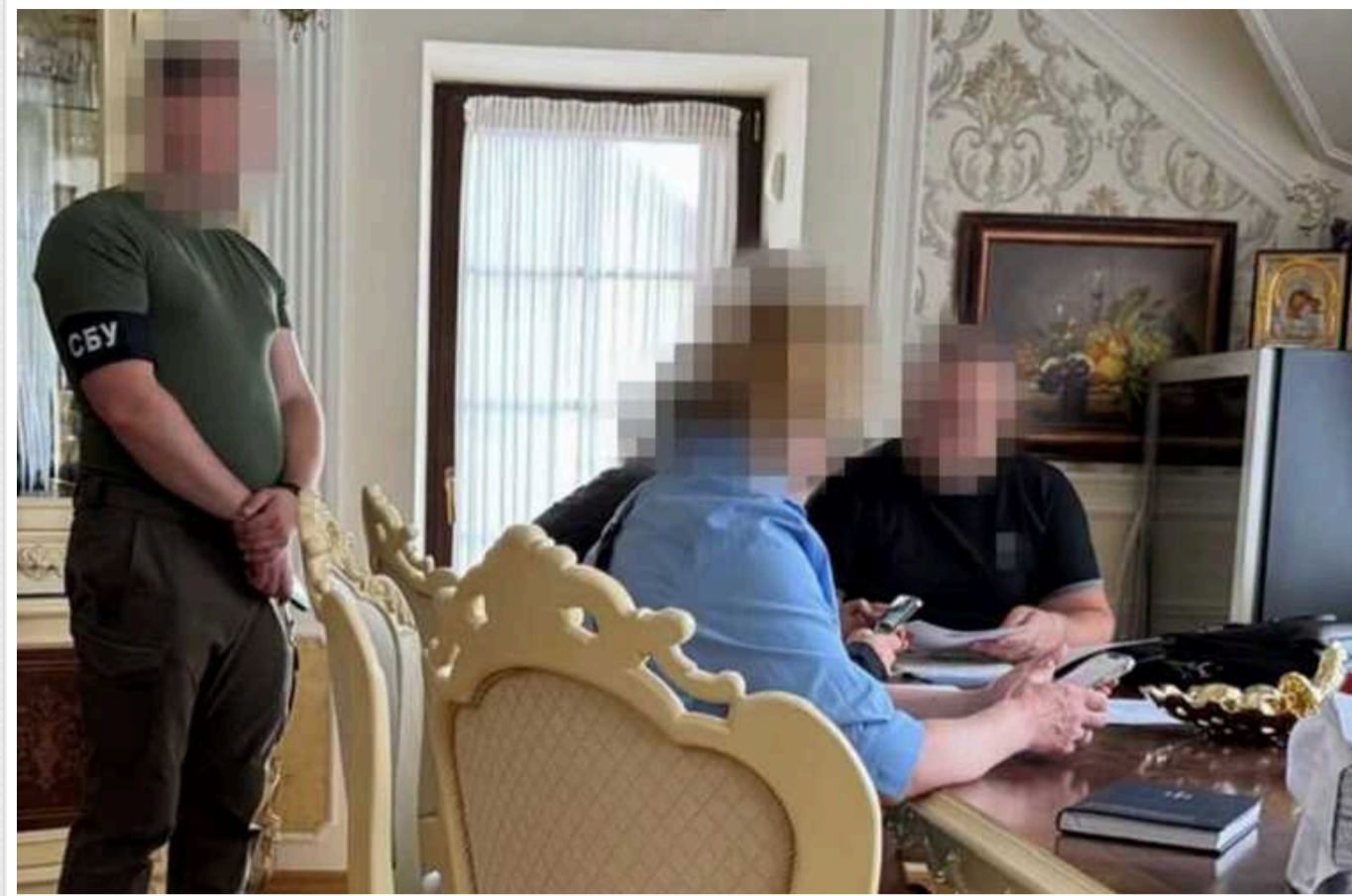
ДБР та СБУ заочно вручили підозри братам екснардепів Віктора Медведчука та Тараса Козака

Сергія Медведчука та Богдана Козака, які перебувають за кордоном, звинуватили у несплаті податків на 75 млн гривень у 2017-2023 роках.