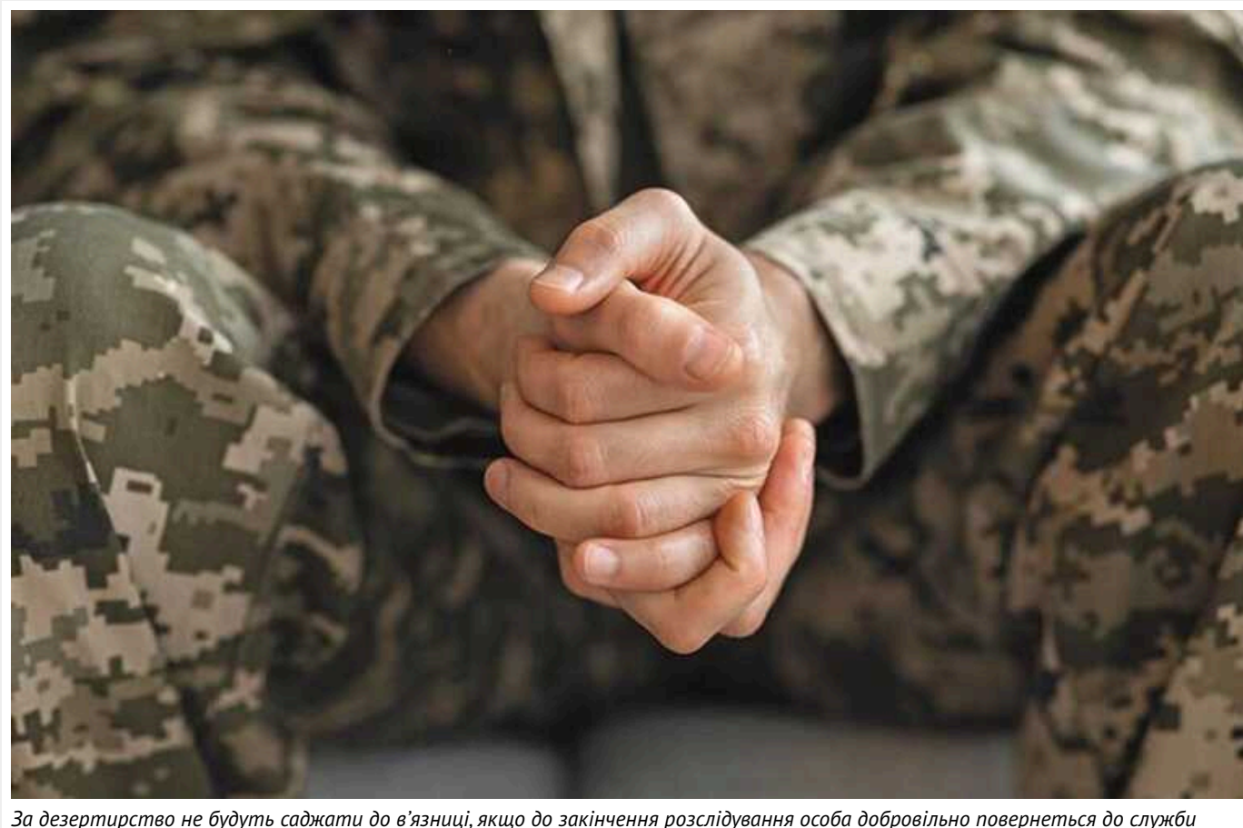
За дезертирство не будуть саджати до в'язниці, якщо до закінчення розслідування особа добровільно повернеться до служби