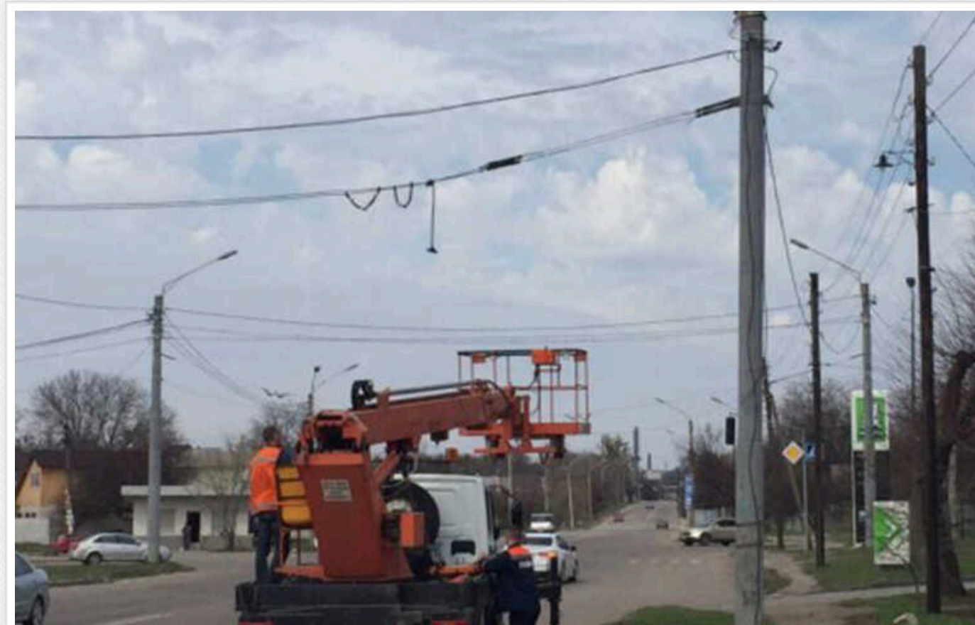
У Харкові КП «Міськвітло» замовило проводи на третину дорожче від ринку

КП «Міськвітло» Харківської міської ради 5 червня за результатами тендеру замовило ТОВ «Компанія «Вестдевелопмент» кабелів і проводів на 5,91 млн грн.