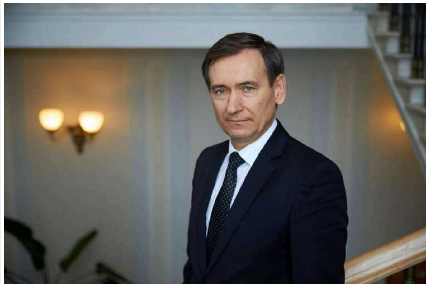
Веніславський: Влада все ще розглядає питання економічного бронювання

Питання про економічне бронювання, як і раніше, розглядається, але напрацьованих алгоритмів поки немає.