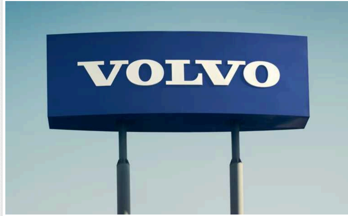
Компанія Volvo переносить виробництво електромобілів із КНР у Бельгію на фоні можливої війни тарифів між ЄС і Китаєм

Volvo зі штаб-квартирою у Швеції, мажоритарним власником якої є китайський автовиробник Geely, розглядає плани перенесення виробництва деяких авто з КНР до Бельгії.