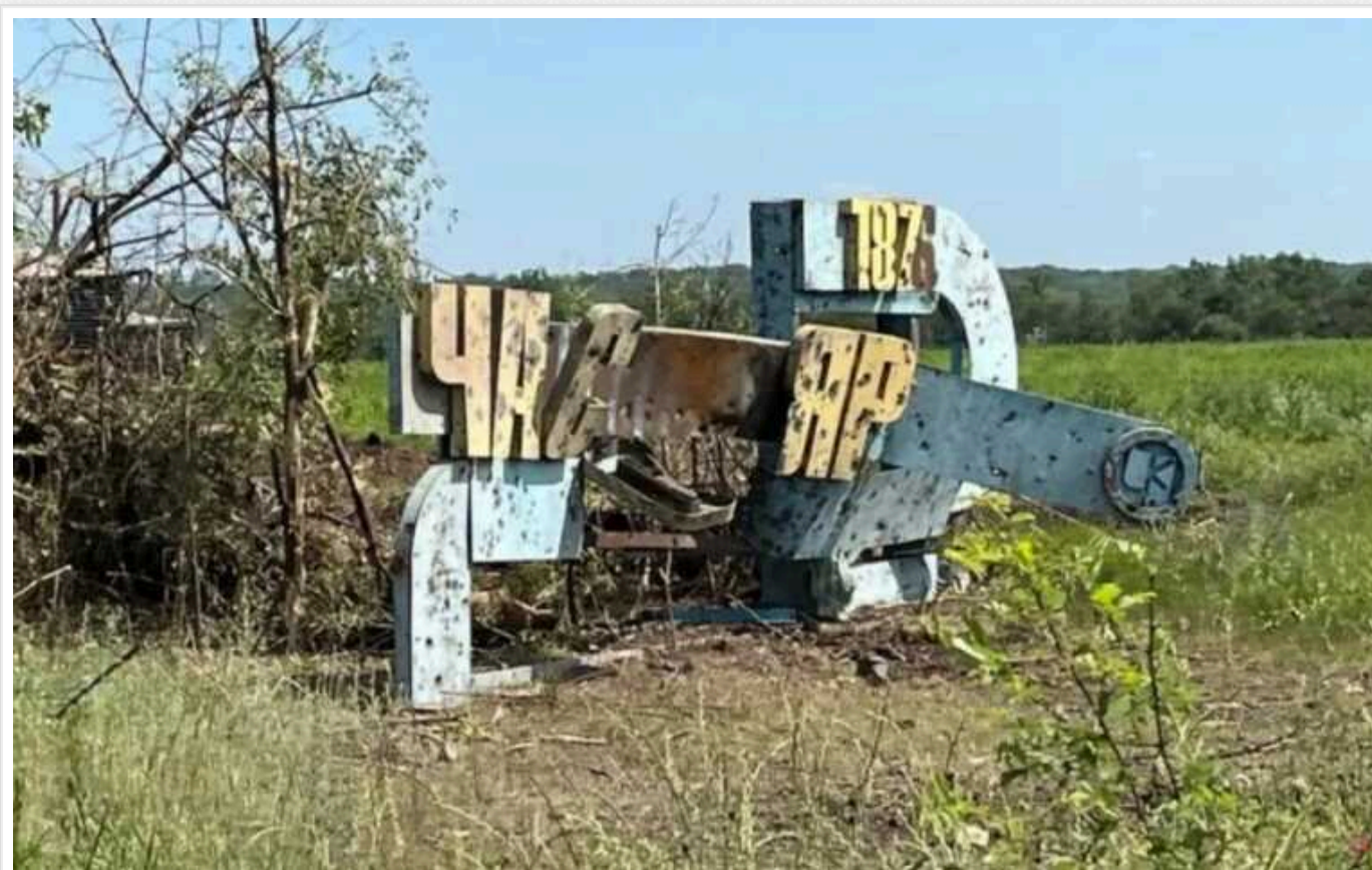
В ОСУВ "Хортиця" спростували прорив окупантів у Часовому Яру

Часів Яр залишається під контролем Сил оборони України. Водночас російські окупанти активізували свої зусилля поблизу міста.