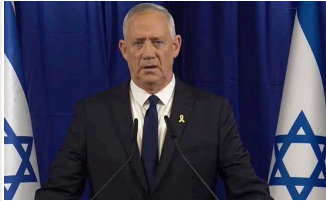
Ізраїльський уряд розвалюється: міністр Бені Ганц залишає кабінет

Ганц – лідер партії "Національна єдність". Він приєднався до прем'єра Нетаньягу після початку війни в Газі та сформував із ним надзвичайний уряд.