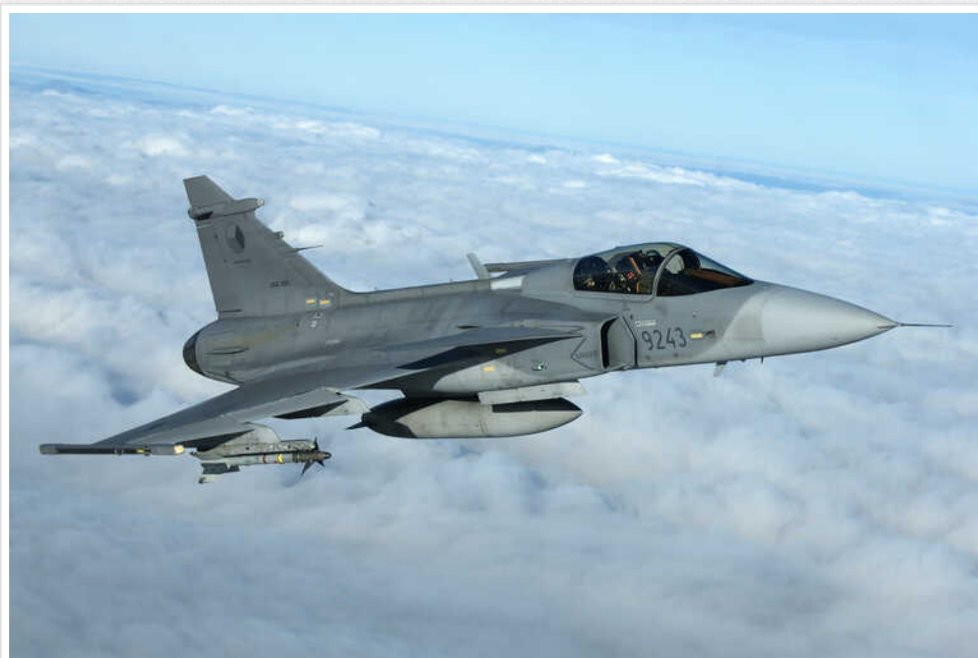
Україна має інфраструктуру для використання шведських винищувачів Gripen, - ПС

Україна хотіла б отримати шведські винищувачі Gripen разом з з F-16, Eurofighter і Rafale. У нашій країні є інфраструктура для їхнього використання.