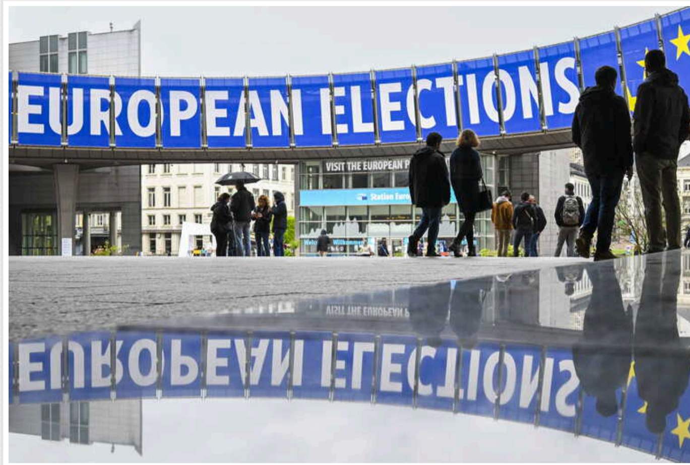
Politico: Вибори до Європейського парламенту змінять політичний ландшафт континенту

Видання зазначає, що по всій Європі радикальні праві, які опонують нинішній владі ЄС, перебувають на підйомі.