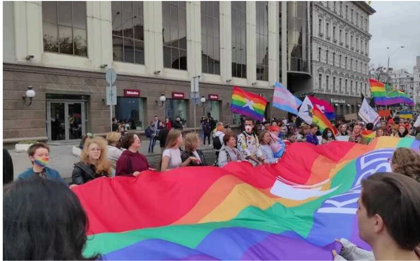
ТЦК прийшли до організаторів столичного "КиївПрайду"

Організатори "КиївПрайду" поскаржилися на те, що під час підготовки вечірки у клубі Closer до них прийшли представники територіального центру комплектування та соціальної підтримки Подільського району. Організатори ЛГБТ-прайду заявляють: це був тиск на них.