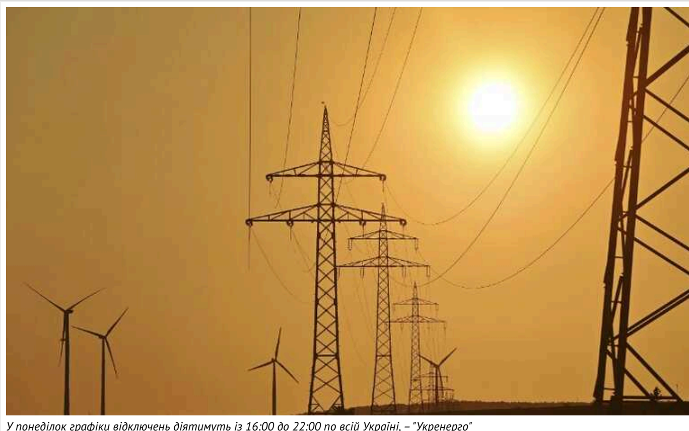
У понеділок графіки відключень діятимуть із 16:00 до 22:00 по всій Україні, – "Укренерго"

Завтра, 10 червня, графіки погодинних відключень електроенергії застосовуватимуть по всій території України з 16:00 до 20:00.